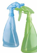
Nuevos pulverizadores en varios formatos