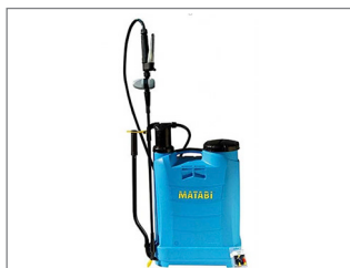
Mochila Pulverizadora Manual 16L _____ Cod: 33852

Esta mochila con depósito resistente y ligero de polipropileno e indicador traslucido de nivel lateral, para visualizar la cantidad de producto en el tanque. El regulador de presión regula de 1,5 a 3 bares y a paso libre, permite controlar la aplicación de los tratamientos.