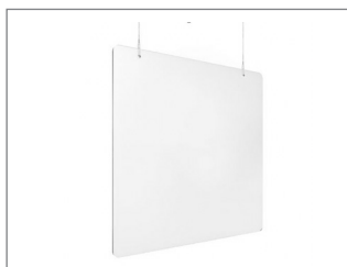
Mampara metacrilato 1.000mm ancho y 1.000mm alto recta para colgar _____ Cod: 33886

Mampara de separación de metacrilato transparente con bordes redondeados y 5mm de grosor. Cuenta con 2 soportes y hueco dispensador en la parte inferior de 300 mm de ancho x 100 mm de alto. 100% reciclable.