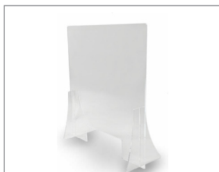
Mampara metacrilato 600mm ancho y 660mm alto y hueco dispensación _____ Cod: 33885

Mampara de separación de metacrilato transparente con bordes redondeados y 4mm de grosor. Cuenta con 2 soportes y hueco dispensador en la parte inferior de 300 mm de ancho x 100 mm de alto. 100% reciclable.