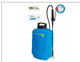
Mochila Pulverizadora a batería 15L _____ Cod: 33881

Esta mochila con depósito resistente y ligero de polipropileno e indicador traslucido de nivel lateral, para visualizar la cantidad de producto en el tanque. El regulador de presión regula de 1,5 a 3 bares y a paso libre, permite controlar la aplicación de los tratamientos.