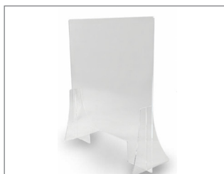
Mampara metacrilato 1.000mm ancho y 1.000mm alto pliegues laterales y hueco dispensación _____ Cod: 33906

Mampara de separación de metacrilato transparente con bordes redondeados y 5mm de grosor. Cuenta con 2 soportes y hueco dispensador en la parte inferior de 300 mm de ancho x 100 mm de alto. 100% reciclable.