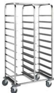
Distribución y exposición de alimentos - Carros - Carro con guías para bandejas isotérmicas