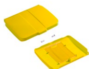
Tapa soporte de bolsa 120 L con tabla porta notas