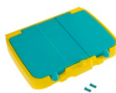
Tapa doble fondo para soporte de bolsa 120 L