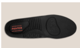
PLANTILLA ANATÓMICA Antiestática Antibacteriana Antihongos

Tel: (+34) 965 310 613 Fax: (+34) 965 312 185