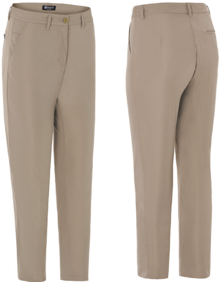
01 06 07 NEGRO BEIGE MARINO