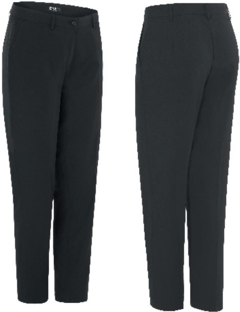
01 07 59 Negro Marino Gris oscuro