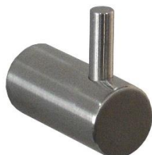
AI0010C Acabado brillante