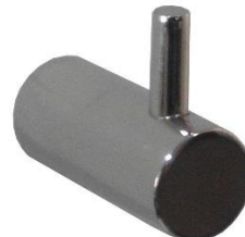
AI0010CS Acabado satinado