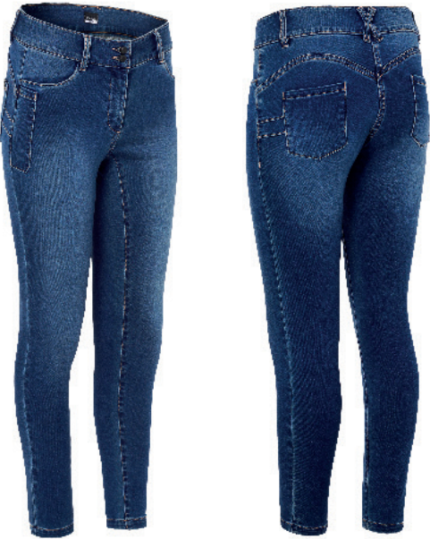
186 Denim negro