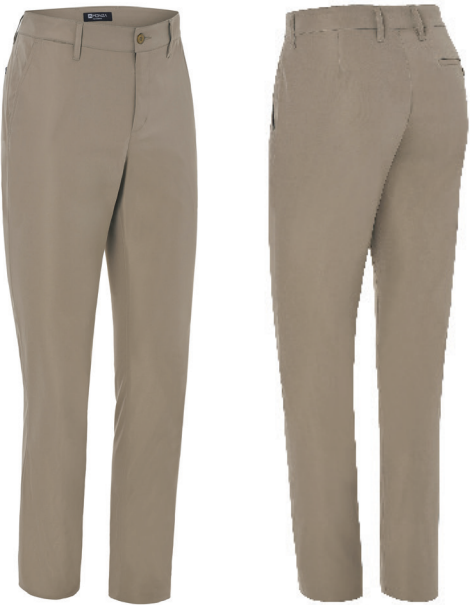
01 NEGRO 06 BEIGE 07 MARINO