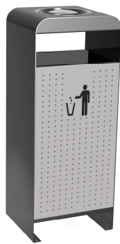
REF.: 400PC Perforación 703