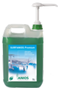
Surfanios Premium Envase de 5 L

Detergente Desinfectante de Suelos y Superficies