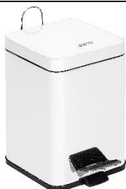
PP1206 / PP1214 Acabado blanco