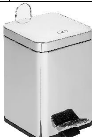
PP1206C / PP1214C Acabado brillante