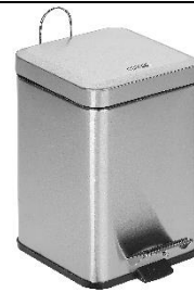
PP1206CS / PP1214CS Acabado satinado