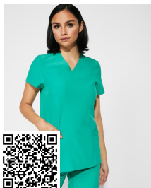
FEROX WOMAN CA9084