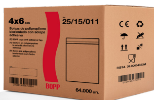
EJEMPLO DE PRESENTACIÓN