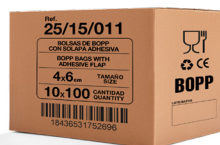
EJEMPLO DE PRESENTACIÓN