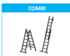
2 formas posibles de uso