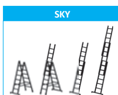
4 formas posibles de uso