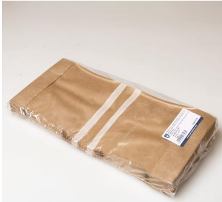
Imagen de paquete