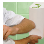
Manos. Riesgo higiénico