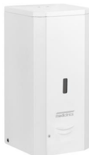
DJ0037A Acabado blanco