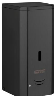
DJ0037AB Acabado negro mate