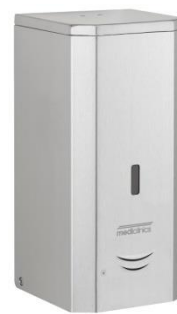
DJ0037ACS Acabado satinado