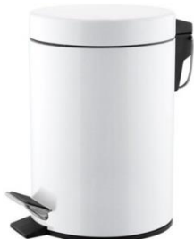
PP1303/PP1305/PP1312/PP1321 Acabado blanco