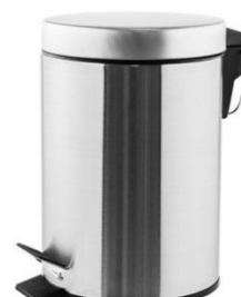
PP1303CS/PP1305CS/PP1312CS/PP1321CS Acabado satinado