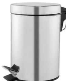
PP1303C/PP1305C/PP1312C/PP1321C Acabado brillante