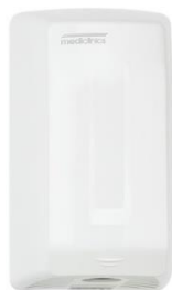
M04A Acabado blanco