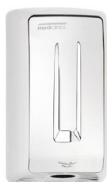
M04AC Acabado brillante