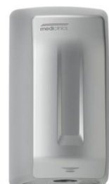
M04ACS Acabado satinado