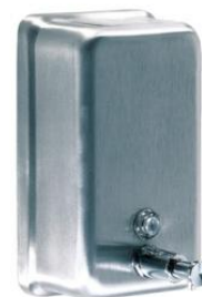
DJ0111CS Acabado satinado