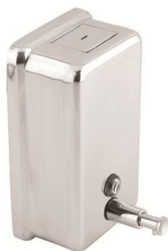
DJ0111C Acabado brillante