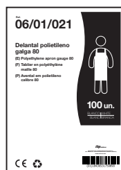
EJEMPLO DE PRESENTACIÓN