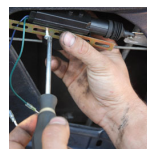
Manos. Lavado industria