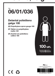
EJEMPLO DE PRESENTACIÓN

MATERIAL BOLSA: Polietileno 100% Virgen (0% reciclado) PESO: 9,45 gr *