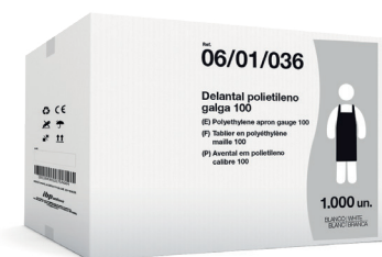
EJEMPLO DE PRESENTACIÓN