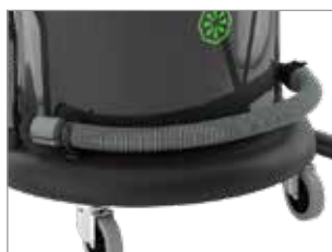
MANGUERA DE DRENAJE