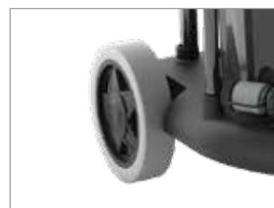
INTERRUPTORES CON INDICADOR LUMINOSO