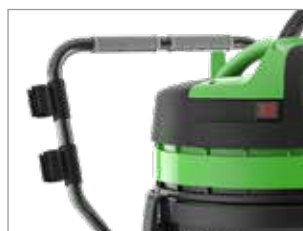
DEPÓSITO CON ASA