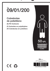
EJEMPLO DE PRESENTACIÓN

MATERIAL BOLSA: Polietileno 100% Virgen (0% reciclado) PESO:7,84 gr *