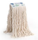
Mopa Ecolabel con banda ancha