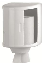
DT0303 Acabado epoxi blanco