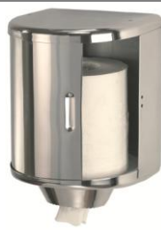
DT0303C Acabado brillante