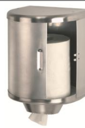
DT0303CS Acabado satinado