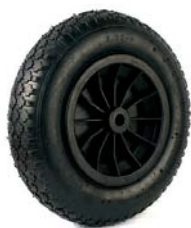
Rueda neumática Ref: 1095-RN