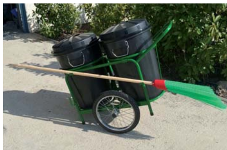
Carro Ref: 1095-RB