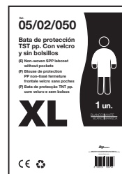
EJEMPLO DE PRESENTACIÓN