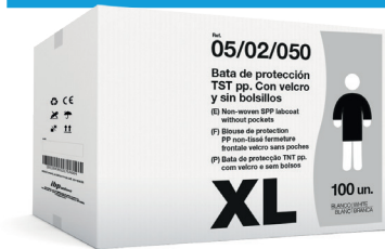
EJEMPLO DE PRESENTACIÓN