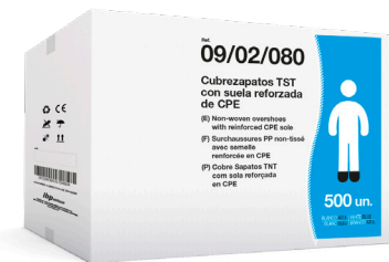
EJEMPLO DE PRESENTACIÓN