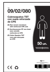
EJEMPLO DE PRESENTACIÓN