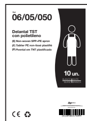
EJEMPLO DE PRESENTACIÓN

MATERIAL BOLSA: Polietileno 100% Virgen (0% reciclado) PESO: 5,36 gr *