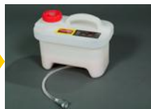
FGQ966000000 – DEPÓSITO PULSE™