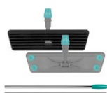
Lamello con mango