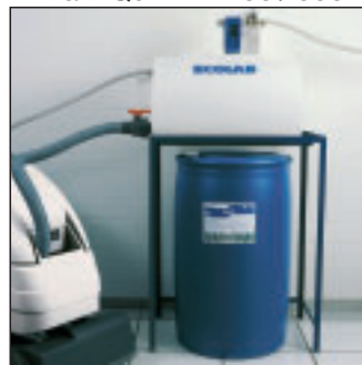
Maxi Quik Fill 100 / 300

Cumple la legislación vigente respecto a Biodegradabilidad y el Reglamento Técnico Sanitario de Detergentes.