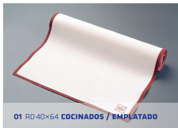
01 RD 40x64 COCINADOS / EMPLATADO