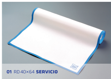
01 RD 40x64 SERVICIO

Un producto patentado, fabricado sin costuras para evitar la acumulación de gérmenes y bacterias. Su práctico formato en rollos precortados de 10 und. los hace manejables, fáciles de usar y de guardar.